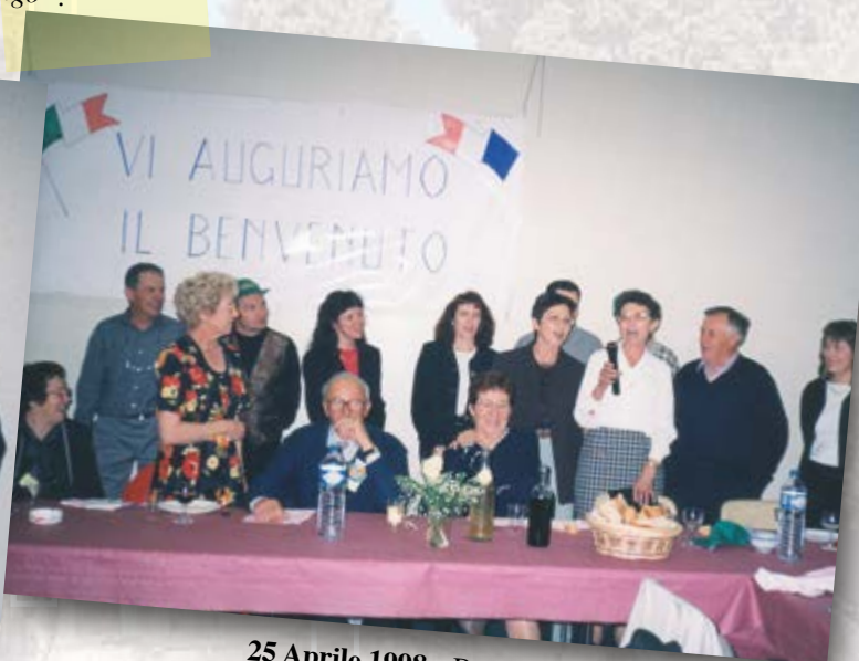
25 Aprile 1998 - Bruguières - Discorso di Nicole. 25 Avril 1998 - Discours de Nicole.