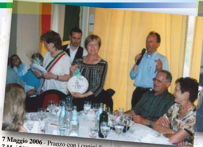
7 Maggio 2006 - Pranzo con i cugini francesi al ristorante "Villa Soligo". 7 Mai 2006 - Déjeuner avec les cousins françaises au restaurant "Villa Soligo".