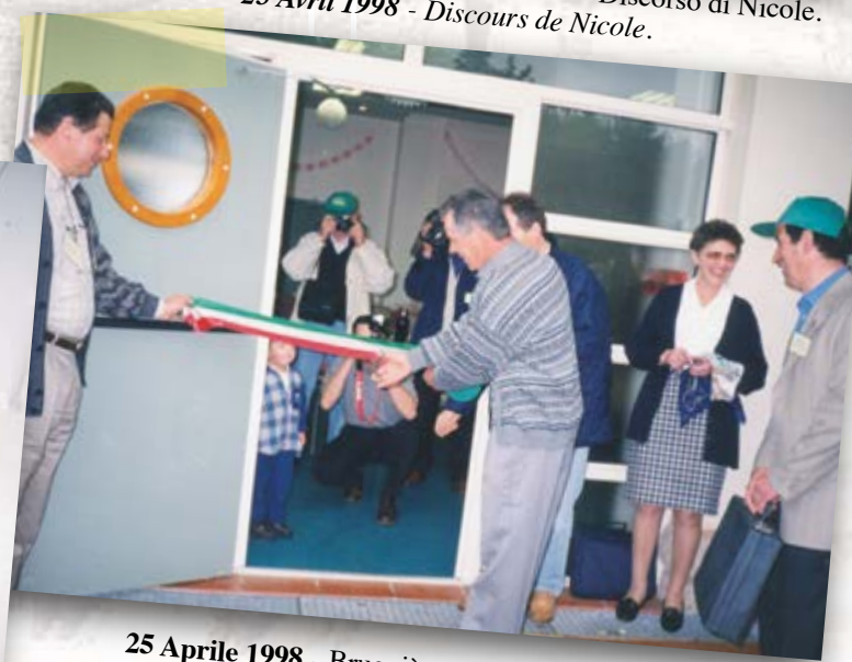
25 Aprile 1998 - Bruguières - Giordano e Roger inaugurano la sede francese di Bruguières. 25 Avril 1998 - Bruguières - Giordano et Roger inaugurent le siège français du Comité à Bruguières.