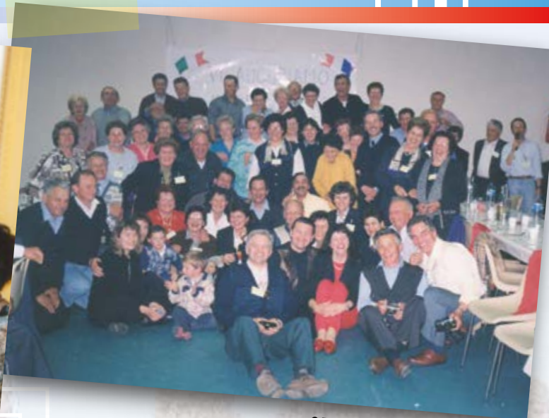
25 Aprile 1998 a Bruguières 25 Avril 1998 à Bruguières