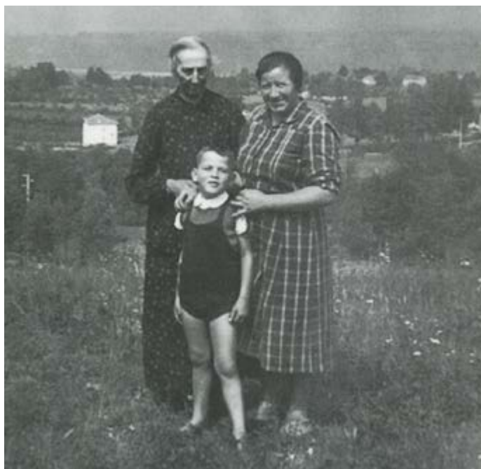
Centore, anno 1955

Si copriva il capo con il velo scuro, si sistemava sempre nel solito banco, sfilava dalla borsa il suo libricino delle preghiere e per tutto il periodo della Messa rimaneva silenziosa. Ricordo che alle volte restava inginocchiata anche quando tutti eravamo seduti. Con le dita incrociate e la testa china la vedevo quasi assente tanto era assorta nei suoi pensieri e nelle sue preghiere. Durante la messa raramente mi rivolgeva parola e bastavano le sue occhiate per portarmi all'ordine. Ricordo che la guardavo e da bambino non comprendevo il motivo di questo cambiamento di umore.